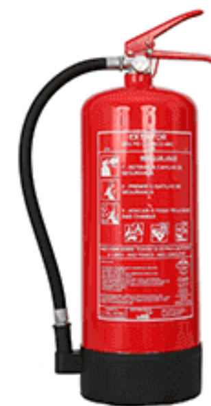
PÓ QUÍMICO SECO, P.Q.S. PRESSURIZADO