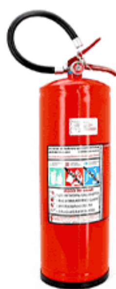
ÁGUA, GÁS E ÁGUA PRESSURIZADA